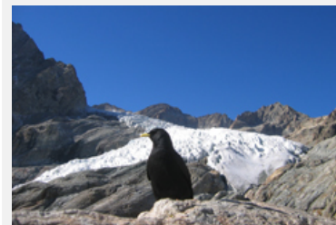
Der Glacier blanc, eines der Wahrzeichen des Ecrins-Nationalparks.

Infos: http://www.alpweek.org (de/fr/it/sl/en)