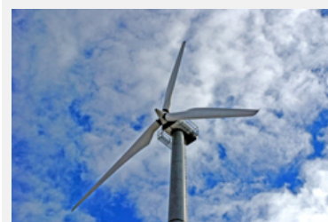
Die Koordination von Windkraftprojekten geschieht kantonsintern oder interkantonal.

Quellen und Infos: NZZ 12.11.2007, Seite 10, Berner Zeitung 6.11.2007, http://www.wind-energie.ch (de/fr)